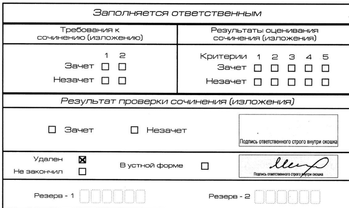
Рис. 11. Заполнение полей нижней части бланка регистрации (удаление с экзамена)