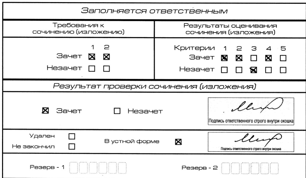
Рис. 9. Область для оценки работы сочинения (изложения) в устной форме

После окончания заполнения бланка регистрации ответственное лицо ставит свою подпись в специально отведенном для этого поле.