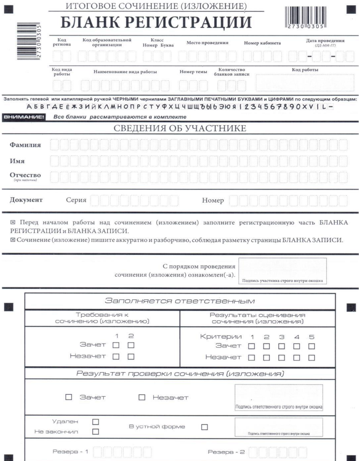
Рис. 1. Бланк регистрации

В верхней части бланка регистрации (рис. 2) расположены: вертикальный и горизонтальный штрихкоды; поля для рукописного занесения информации; строка с образцами написания символов.