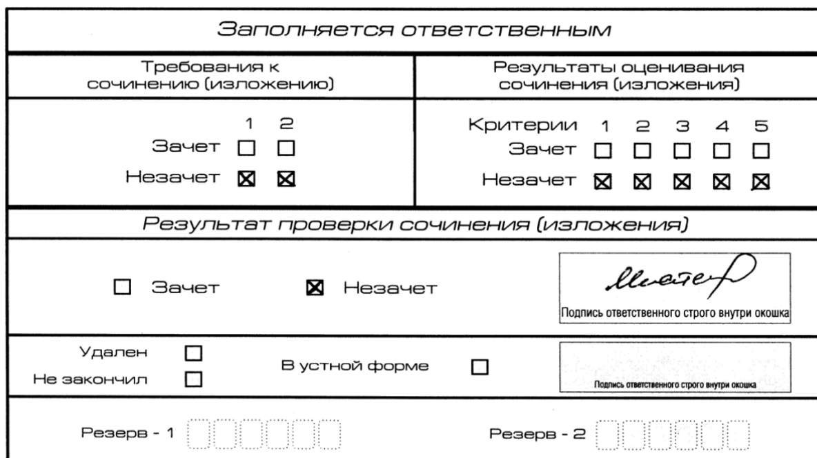
Рис. 6. Область для оценки работы