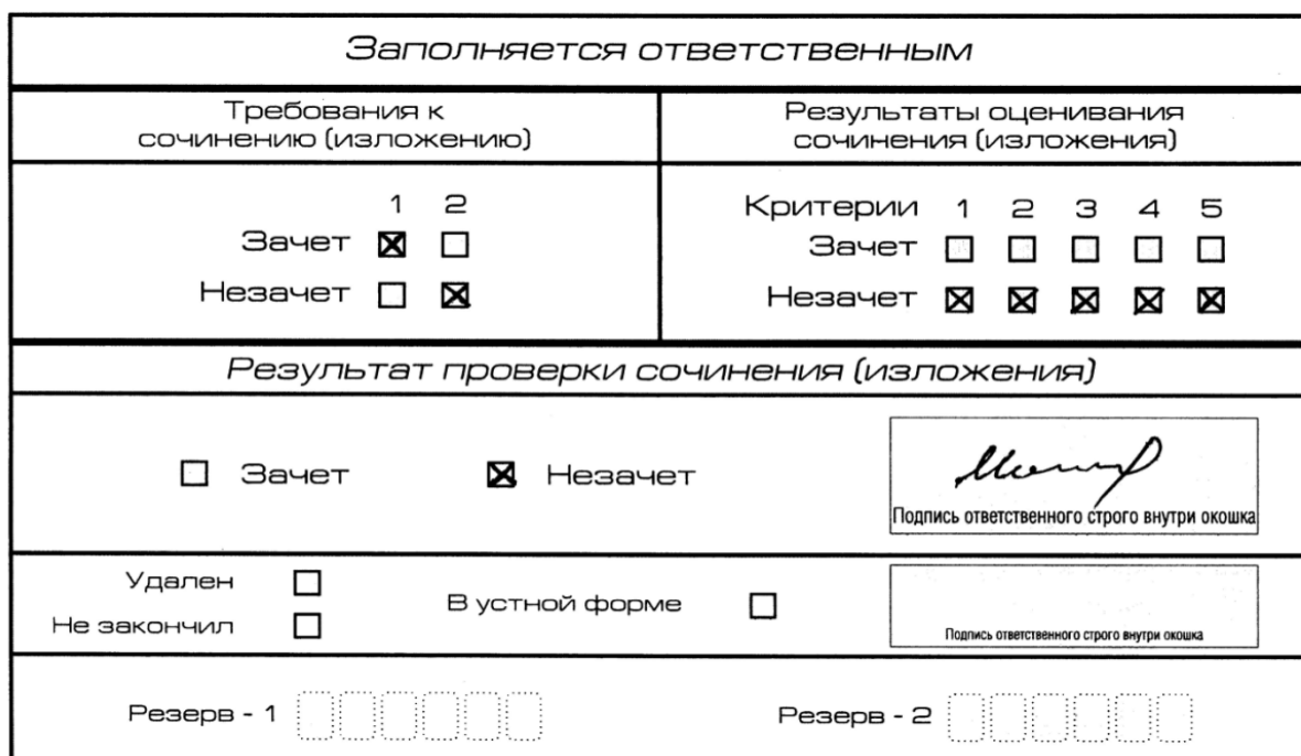
Рис. 7. Область для оценки работы

Если ИС(И) соответствует требованию № 1 и требованию № 2, то выставляется «зачет» за выполнение требования № 1 и требования № 2. Указанные сочинения (изложения) далее оцениваются по критериям.