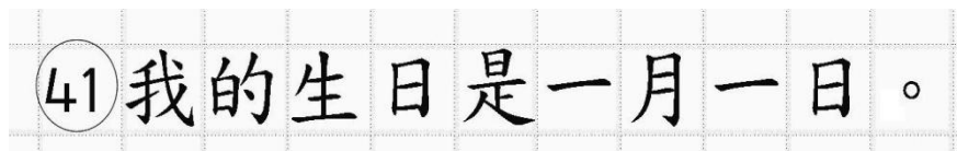
Рис.14. Образец написания иероглифических знаков

Односторонний бланк ответов № 2 (лист 1 и лист 2) предназначен для записи ответов на задания с развернутым ответом по китайскому языку (строго в соответствии с требованиями инструкции к КИМ и к отдельным заданиям КИМ). Каждый иероглифический знак и каждый знак препинания следует писать внутри отдельной клетки области ответов бланка ответов №2 (дополнительного бланка ответов №2) (рис. 14).