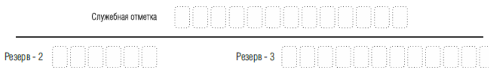
Рис. 5. Поля для служебного использования

Поля для служебного использования «Служебная отметка», «Резерв-2» и «Резерв-3» не заполняются.